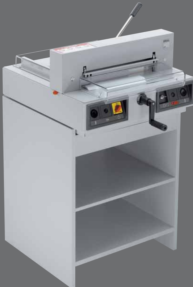
IDEAL 4215 con mueble adicional