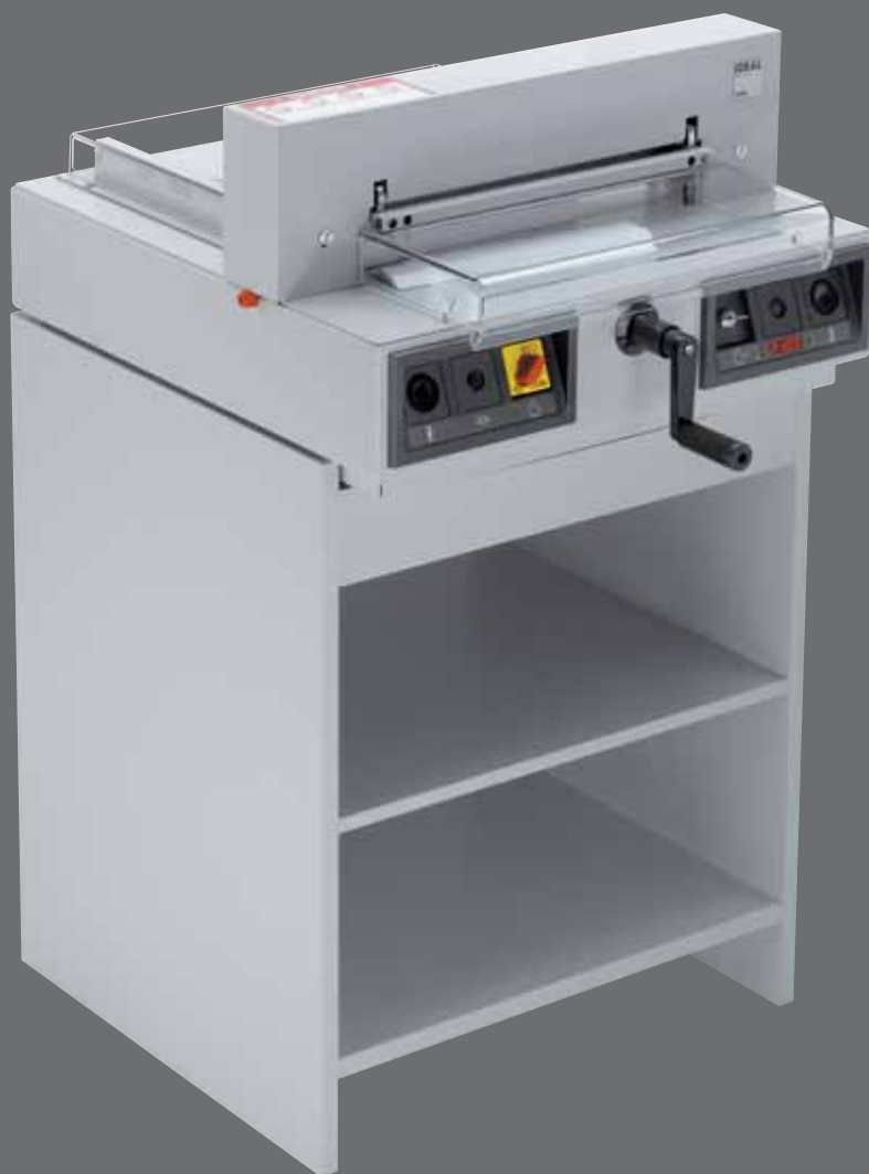
IDEAL 4250 con mueble adicional